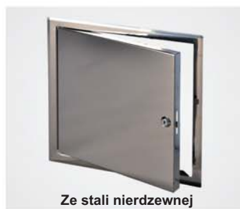
Ze stali nierdzewnej