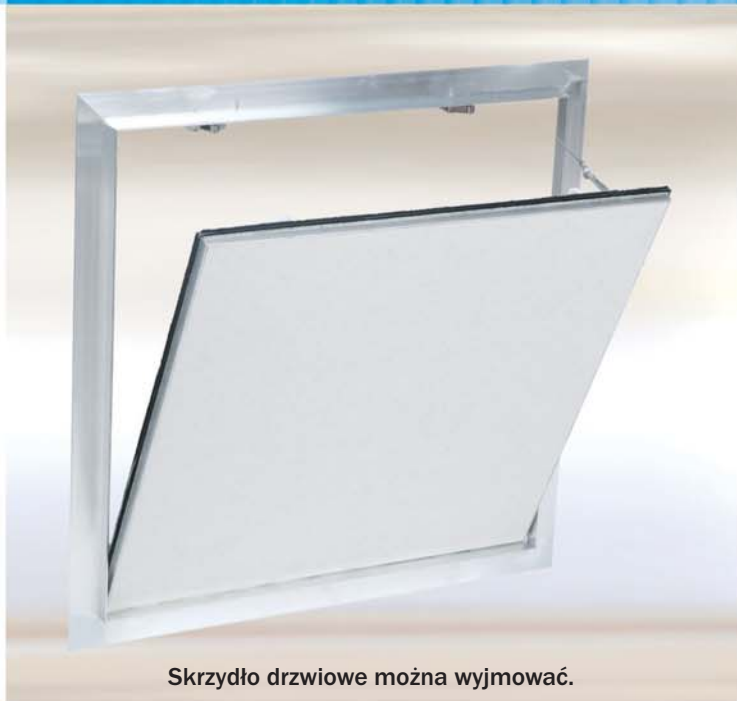
Skrzydło drzwiowe można wyjmować.