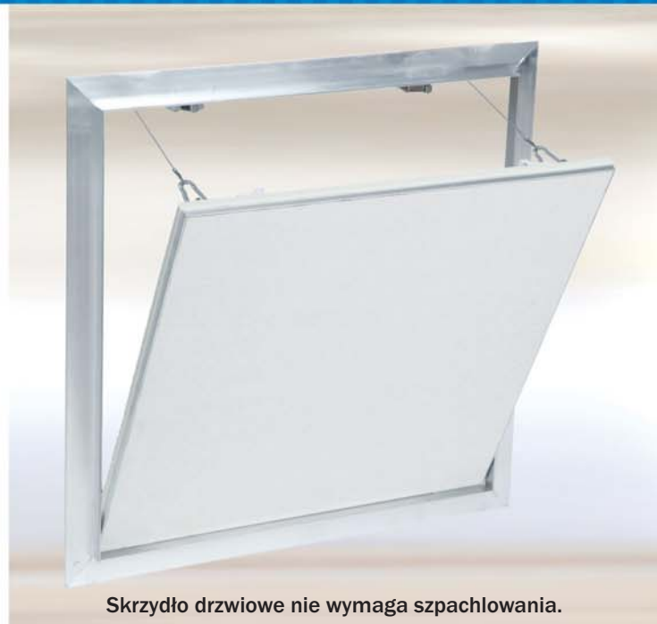
Skrzydło drzwiowe nie wymaga szpachlowania.

Kłapa może być z powodzeniem stosowana w ścianach i sufitach (bez możliwości wchodzenia). Między ramą a skrzydłem drzwiowym jest szczelina szerokości 1,5 mm wypełniona na całym obwodzie uszczelką. Ukryte zamki zapadkowe otwierają kłapę po jej naciśnięciu.