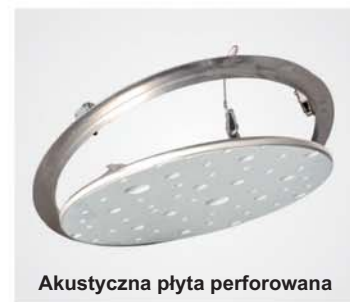
Akustyczna płyta perforowana