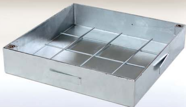
Stal ocynkowana ogniowo

Wykorzystywane w budownictwie jako doskonałe rozwiązanie umożliwiające dostęp do instalacji umieszczonych w posadzce.