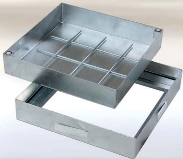
Stal ocynkowana ogniowo