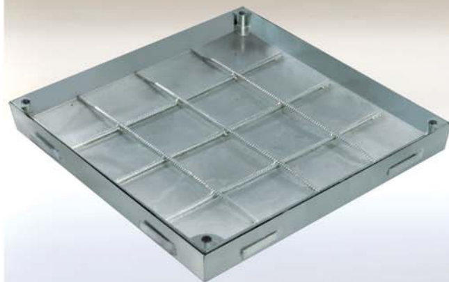
Stal ocynkowana ogniowo

Do leżących na równi z podłożem szachtów w obszarze wewnętrznym i zewnętrznym.