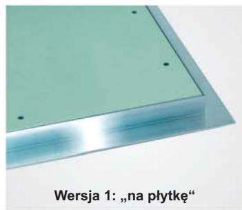
Wersja 1: „na płytkę“