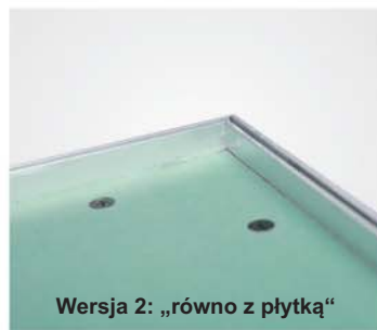
Wersja 2: „równno z płytką“