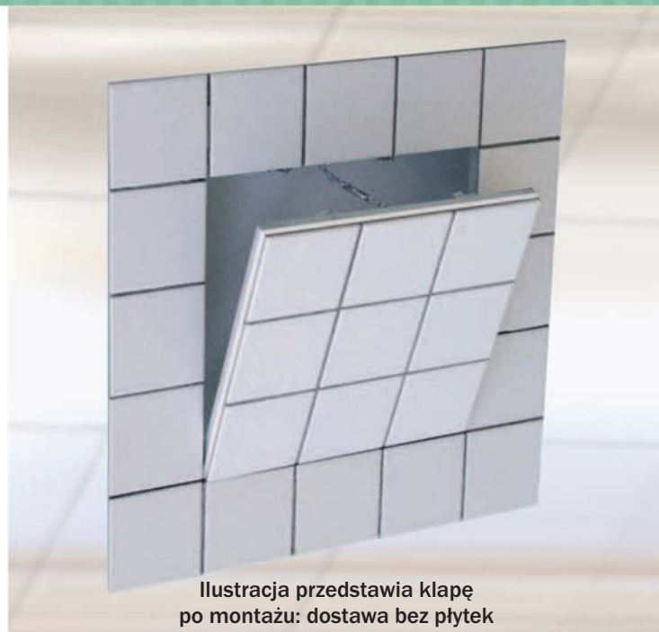
Ilustracja przedstawia klapę po montażu: dostawa bez płytek

Każda z 2 ram klap rewizyjnej składa się z 4 części połączonych specjalną metodą spawania. Od wielkości 300x300mm klapę posiadają zabezpieczenie w postaci linek, które należy zawiesić po każdorazowym otwarciu skrzydła drzwiowego. Między ramą a skrzydłem drzwiowym jest szczelina szerokości 2 mm. Ukryte zamki zapadkowe otwierają klapę po jej naciśnięciu.