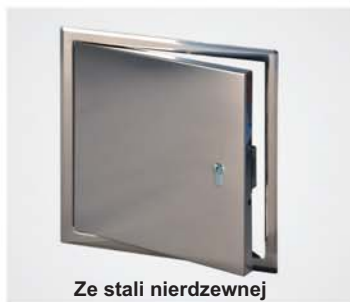
Ze stali nierdzewnej